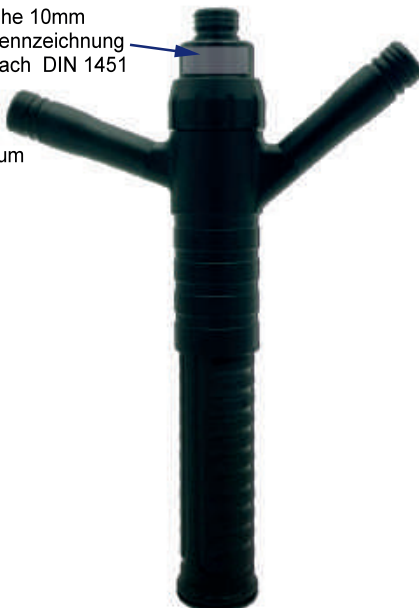
N21C Einsatzstock mit Verteidigungsadapter HG2